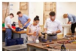
Vocational Education and Training