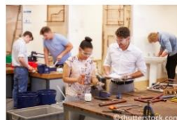
Vocational Education and Training