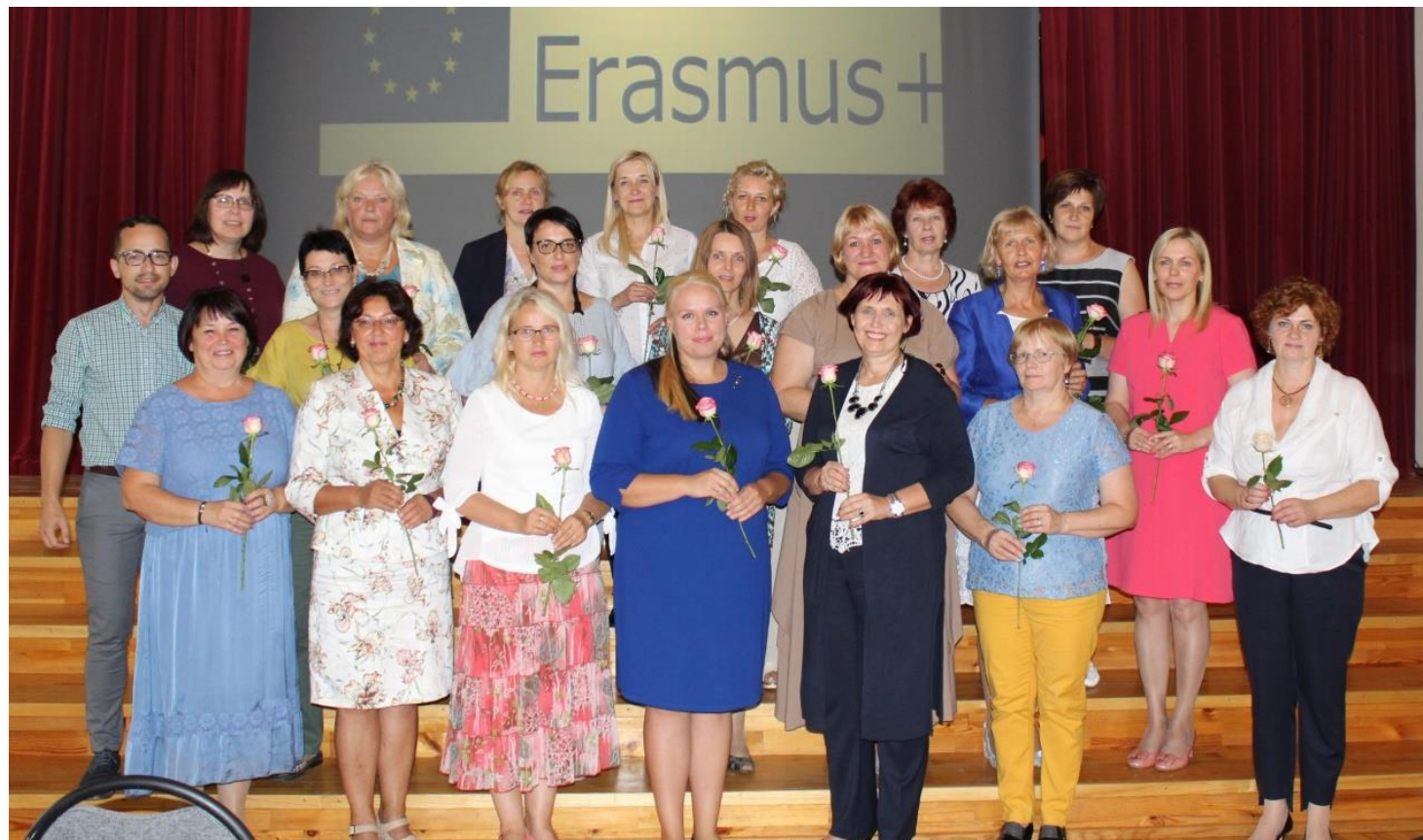
Skolotāji – projekta dalībnieki reģionālās konferences laikā (2018)

Erasmus+ programmas (2014-2020) rezultātu izplatīšanas konference „Erasmus+ kā rīks izglītības iestāžu internacionalizācijai un izglītības kvalitātes paaugstināšanai”. Bellevue Park Hotel Rīga, 2019. gada 11.decembris